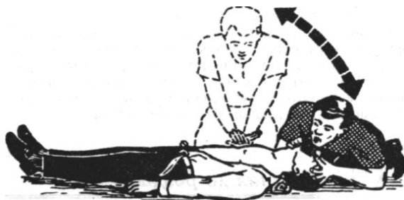
Рис. 1.3. Одновременное выполнение искусственного дыхания и непрямого массажа сердца.

продавливание всем корпусом. Такой массаж требует значительного физического напряжения и очень утомителен. Если реанимацию выполняет один человек, то через каждые 15 надавливаний на грудную клетку с интервалом 1 секунда он должен, прекратив непрямой массаж сердца, провести два сильных вдоха (с интервалом 5 секунд). При участии в реанимации двух человек (рис. 1.3) следует проводить один вдох пострадавшему на каждые 4–5 сдавливания грудной клетки.