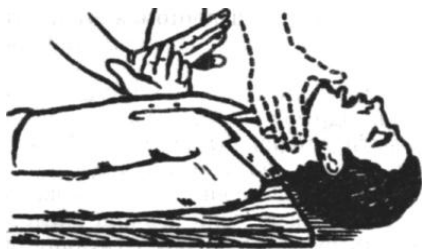
Рис. 1.2. Непрямой массаж сердца.

Смысл непрямого массажа сердца состоит в ритмичном сжатии его между грудной клеткой и позвоночником. При проведении непрямого массажа сердца пострадавшего укладывают спиной на ровную твердую поверхность. Оказывающий помощь становится сбоку, нащупывает нижний край грудины и на 2–3 пальца выше кладет на нее опорную часть ладони, сверху накладывает другую ладонь под прямым углом к первой, при этом пальцы не должны касаться грудной клетки (рис. 1.2). Затем энергичными ритмичными движениями надавливают на грудную клетку с такой силой, чтобы прогнуть ее в сторону позвоночника на 4–5 см. Частота нажатий 60–80 раз в минуту.