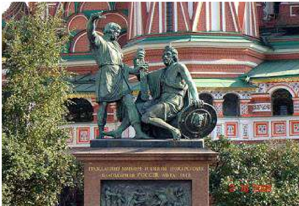
Памятник Кузьме Минину и Дмитрию Пожарскому. Скульптор И.П. Мартос.

Первый крупный скульптурный памятник Москвы – памятник гражданину Нижнего Новгорода Кузьме Миничу Минину (?–1616) и князю Дмитрию Михайловичу Пожарскому (1578–1642) – был сооружен в честь этих русских патриотов, возглавивших борьбу народного ополчения России против польско-литовской и шведской интервенции в 1612 году. Средства на памятник (150 тыс. руб.) были собраны по всенародной подписке.