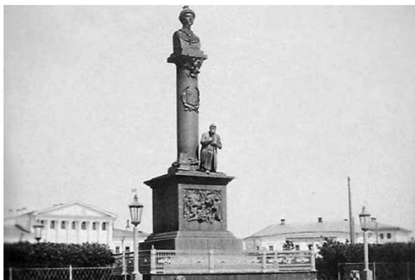
Памятник Ивану Сусанину. Скульптор В.И. Демут-Малиновский.