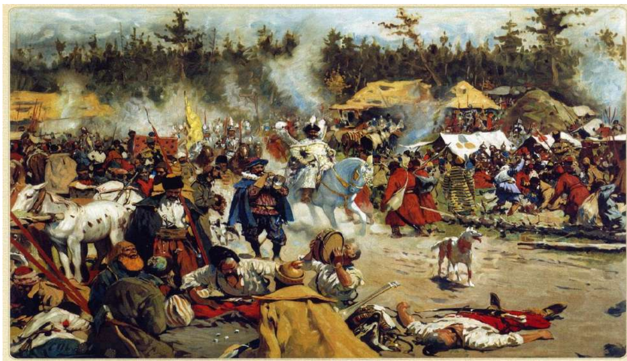
«В Смутное время» (второе название картины – «Лагерь самозванца»). Художник Сергей Иванов, 1908 г.