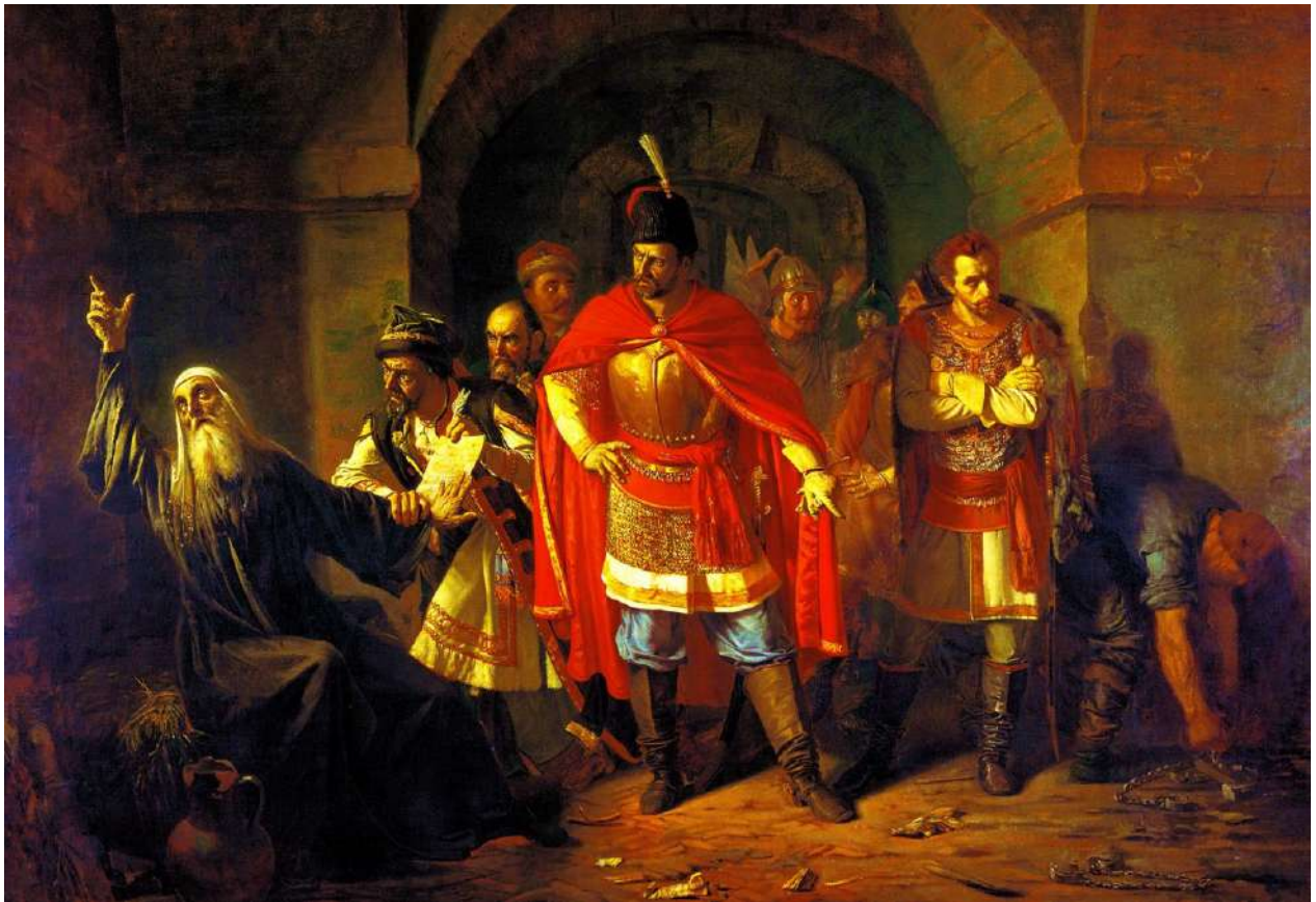
«Патриарх Гермоген в темнице отказывается подписать грамоту поляков». Художник Павел Чистяков, 1860 г.